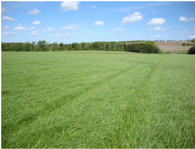
Blanding 42 Bornholm 9/5