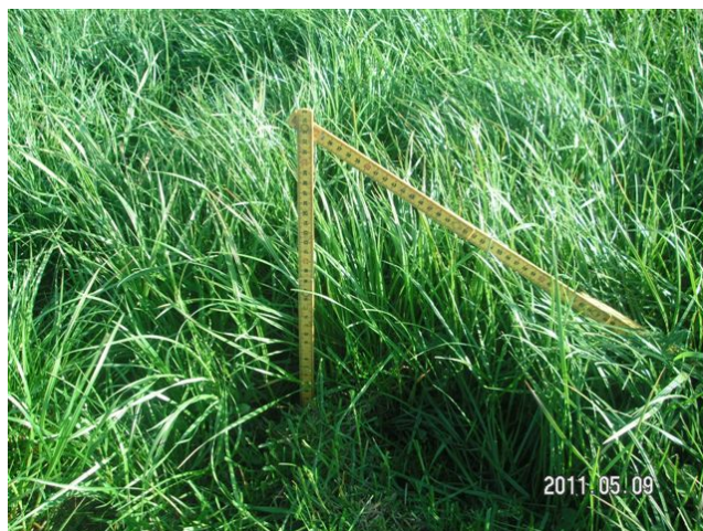
Blanding 22 Føvling 9/5