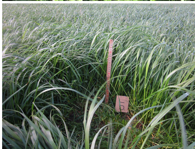
Blanding 46 Sørvad 23/5